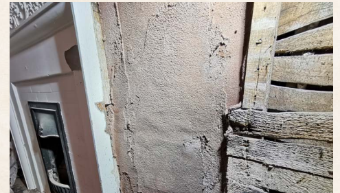
Jednotná farba naznačuje dobré krytie