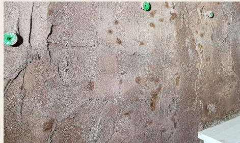
Tmavé škvrny označujú oblasti s nedostatočnou hrúbkou