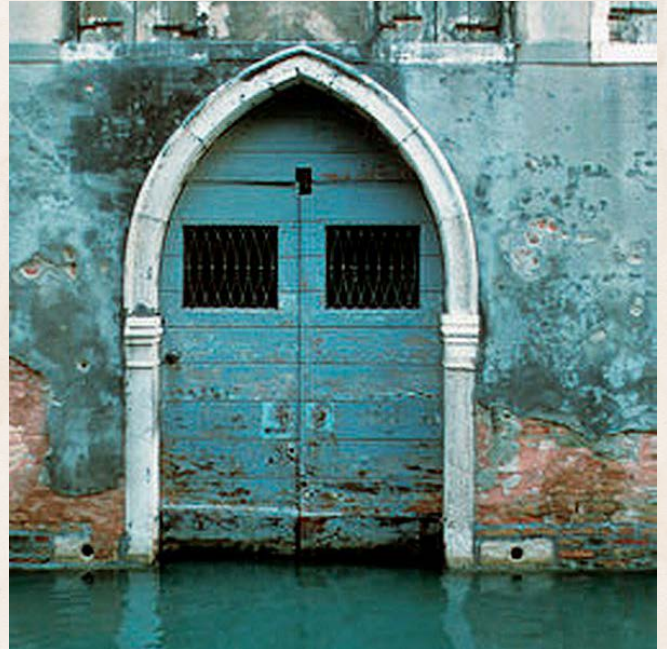
Typický príklad použitia vápenej omietky Rinzaffo MGN v Benátkach: degradované, zasolené murivo v priamom kontakte s vodou

Pretože dokáže dlhodobo odolávať účinkom solí a vlhkosti bez toho, aby došlo k poškodeniu.